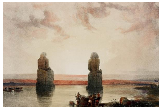
Grafika Dawid Roberts

Wykwaterowanie ze statku. Zwiedzanie starożytnych Teb dawnej stolicy Egiptu i jednego z najważniejszych centrów religijnych świata starożytnego – kompleksu świątynnego Amona w Karnaku . Przejazd na zachodnią stronę Nilu do Doliny Królów , gdzie w ukrytych w skałach grobowcach spoczywali faraonowie Nowego Państwa. Wizyta w świątyni Hatszepsut – wyjątkowej budowli tarasowej wkomponowanej w skalne zbocze, upamiętniającej jedną z nielicznych kobiet-faraonów, przystanek przy Kolosach Memnona – monumentalnych posągach, które stanowiły niegdyś część świątyni grobowej Amenhotepa III. W programie przewidziana jest również wizyta w wytwórni alabastru. Wieczorem przelot do Sharm el Shaikh . Zakwaterowanie w hotelu.